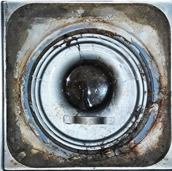
Våtrom - [Sluk bad]