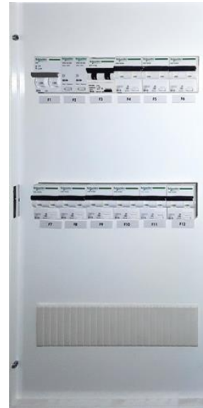
Elektrisk anlegg - [Sikringskap]