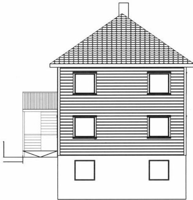
EKS FASADE MOT SØR