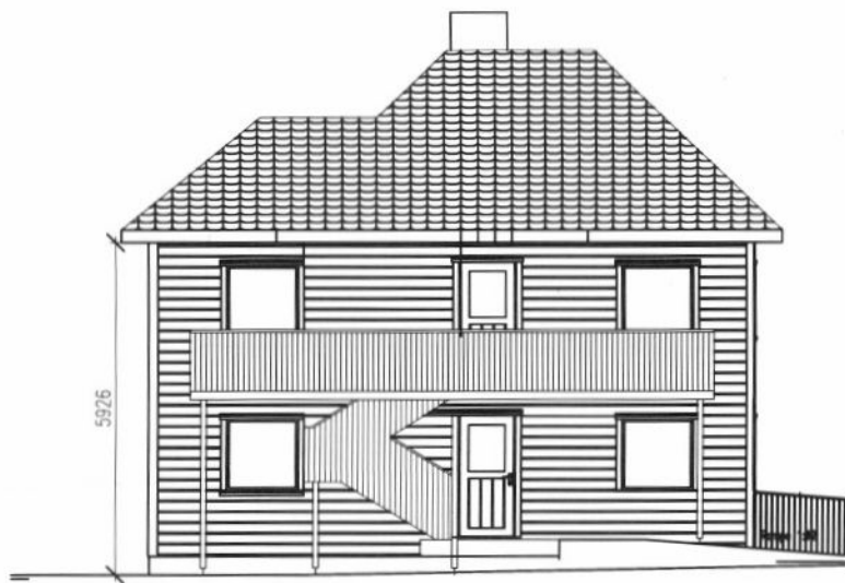
EKS. FASADE MOT VEST