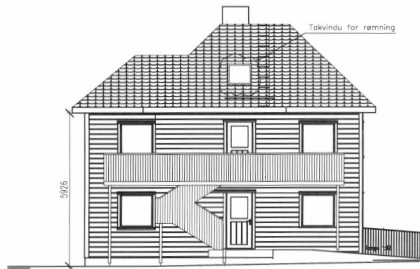
NY FASADE MOT VEST