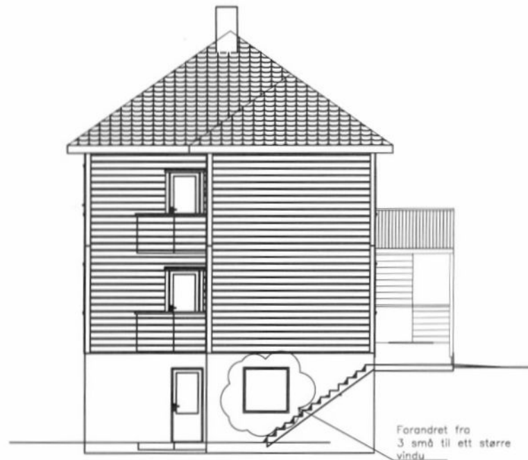
NY FASADE MOT NORD

Forandret fra 3 små til ett større vindu