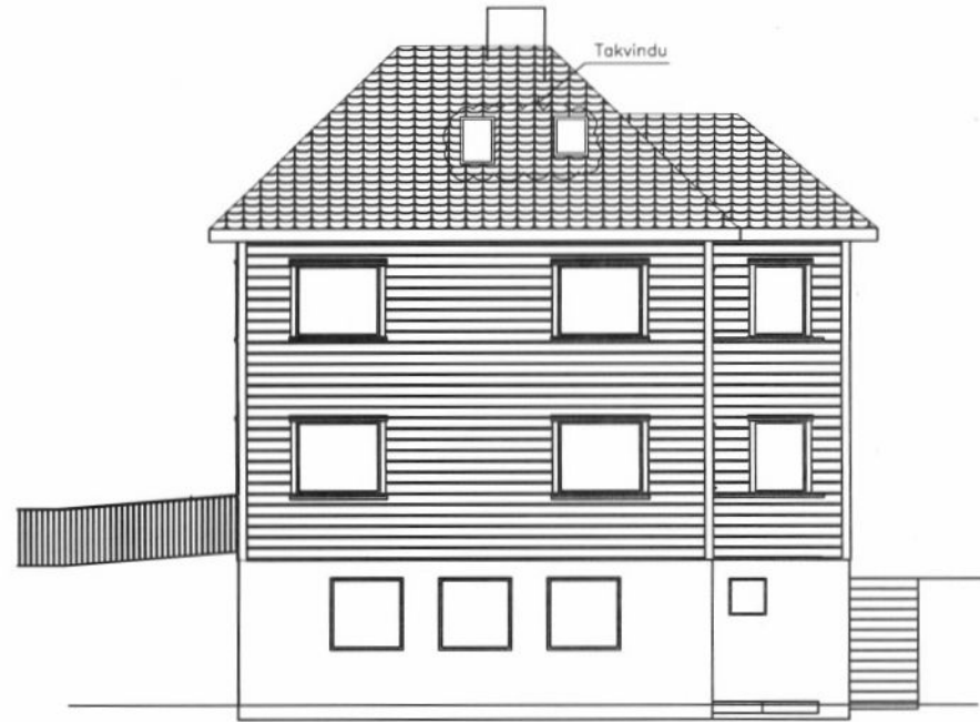
NY FASADE MOT ØST