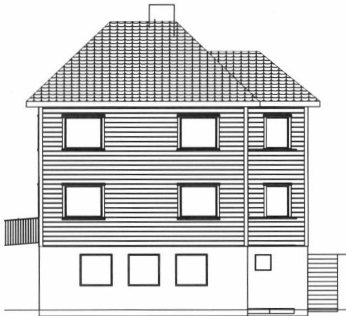
EKS FASADE MOT ØST