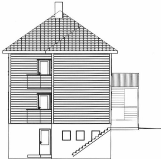
EKS FASADE MOT NORD