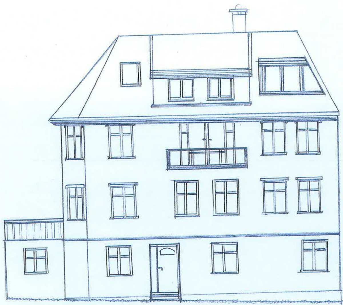
Nåværende fasade vest.