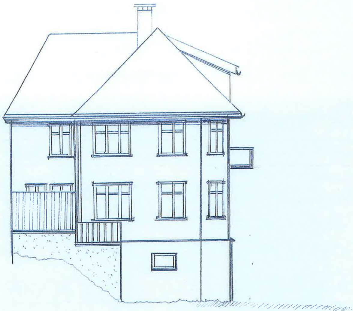
Nåværende fasade nord