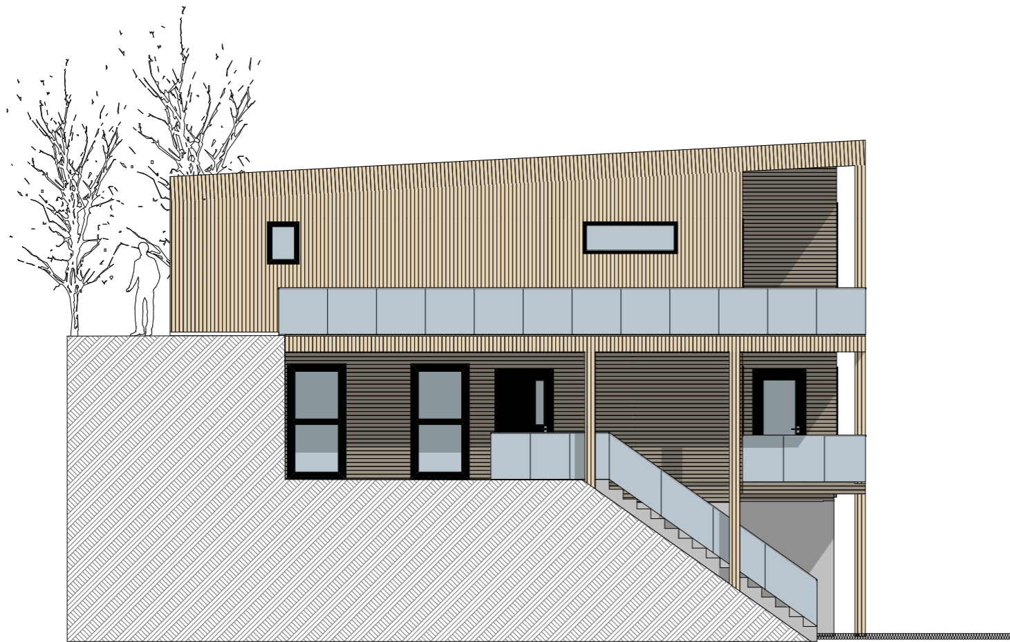
1:100 Fasade Sør