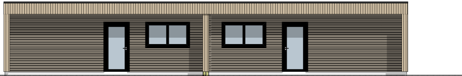
1:100 Fasade Vest