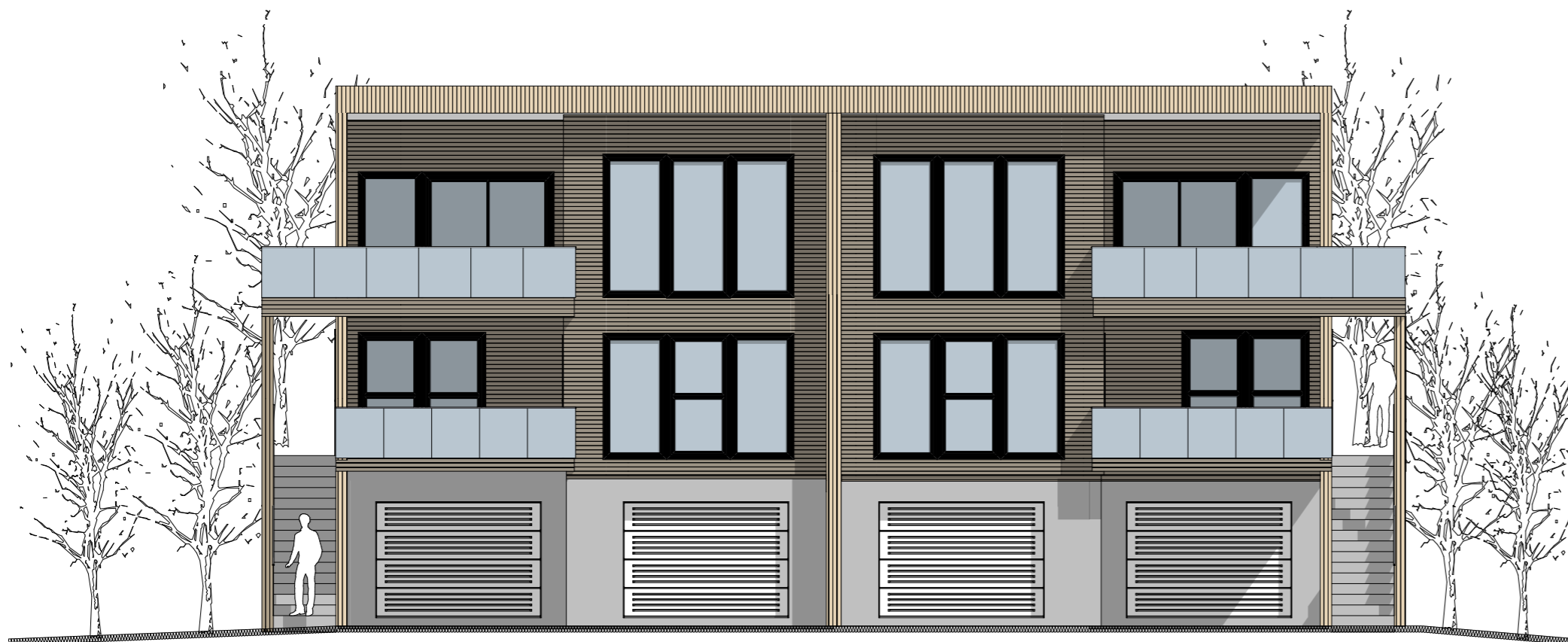
1:100 Fasade Øst