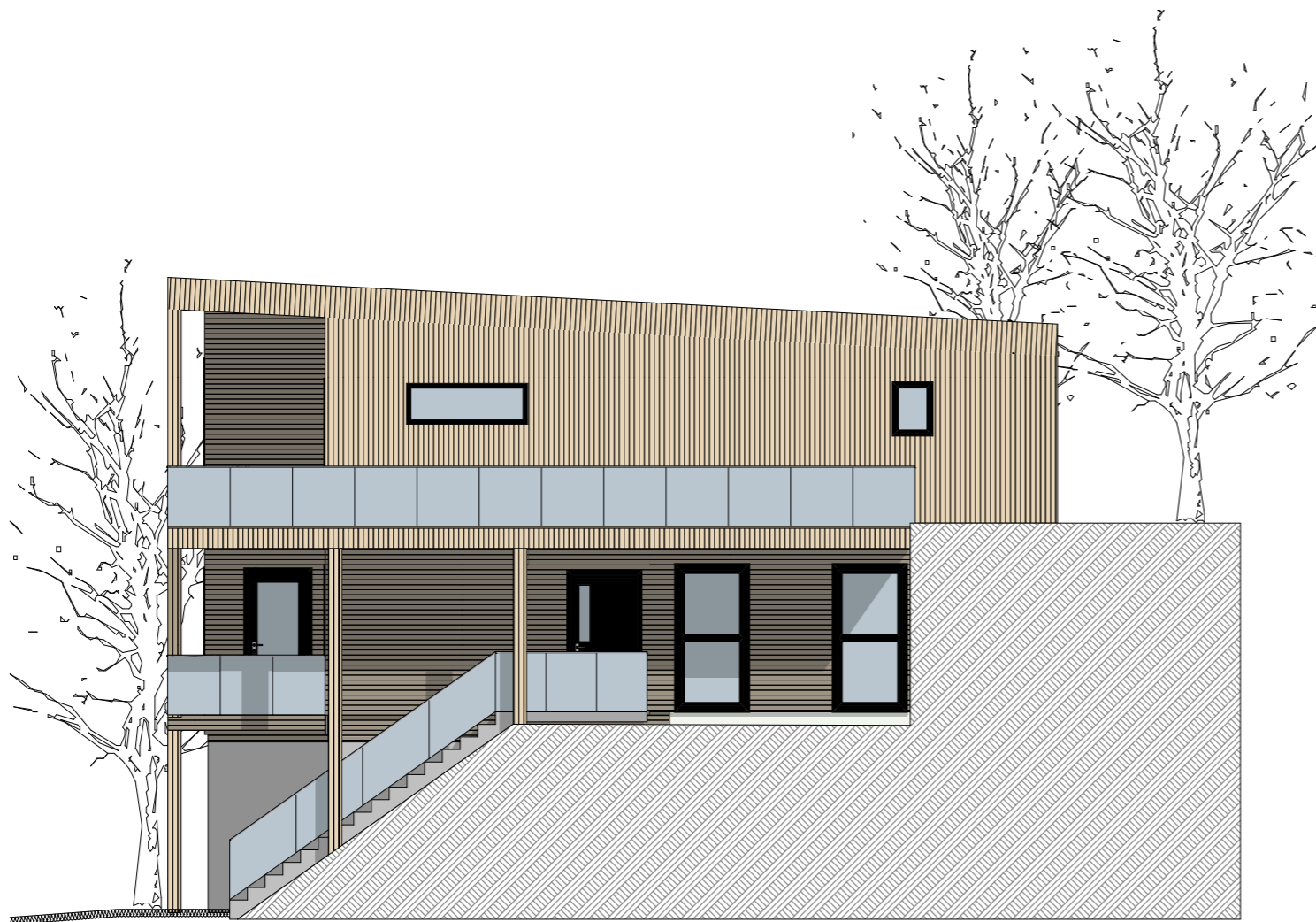
1:100 Fasade Nord